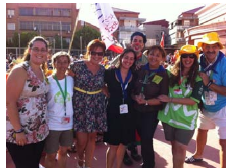
En la fiesta de la familia Calasancio en Escolapios de Getafe

Creo que seguiremos descubriendo cosas, valores y afectos a lo largo de nuestros días. Solo deseo agradecer al Señor por haberme