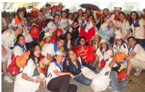
Jóvenes en Cuatro Vientos